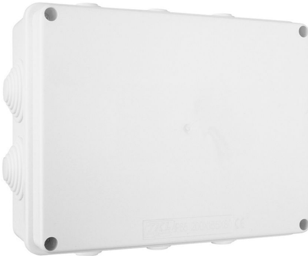
Caja de PVC Tkl Modelo 200x155x80 Blanco con Cono